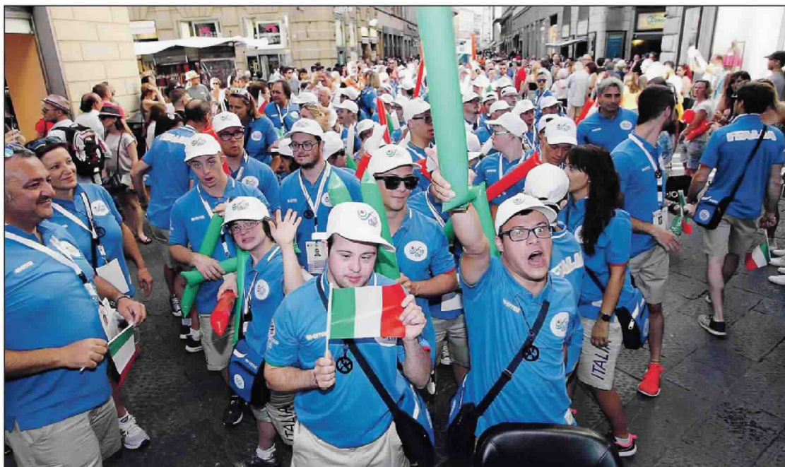
Grande risultato per gli atleti azzurri alla competizione internazionale di Firenze