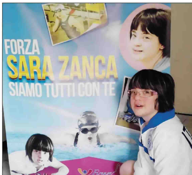
Altro strepitoso risultato per la ragazza di Canaro