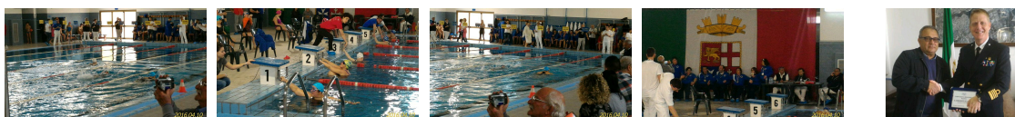
Marina Militare e nuoto per disabili Regione Puglia. Il grazie della FISDIR Regione Puglia alla Maristanav Brindisi

LA FISDIR PUGLIA (Federazione Sportiva per la Disabilità Intellettiva e Relazionale) in unione con il Comitato Paralimpico Regionale ha inteso ringraziare la Marina Militare, attraverso il Comando della MARISTANAVBRINDISI, per la disponibilità dimostrata per la organizzazione e lo svolgimento del Campionato Regionale Nuoto che si è svolto a Brindisi, presso la Piscina "PARODO".