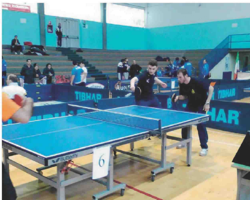
UNA FASE DEL DOPPIO Un'avvincente partita nel corso della kermesse che si è svolta negli ultimi due giorni