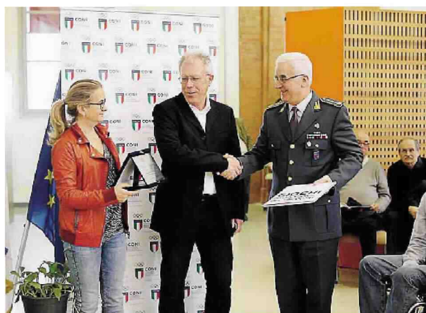
Dall'alto in basso e da sinistra a destra, alcuni momenti della maxi premiazione ieri nell'Aula Magna dell'Università.