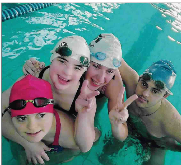
Quattro campioni polesani protagonisti