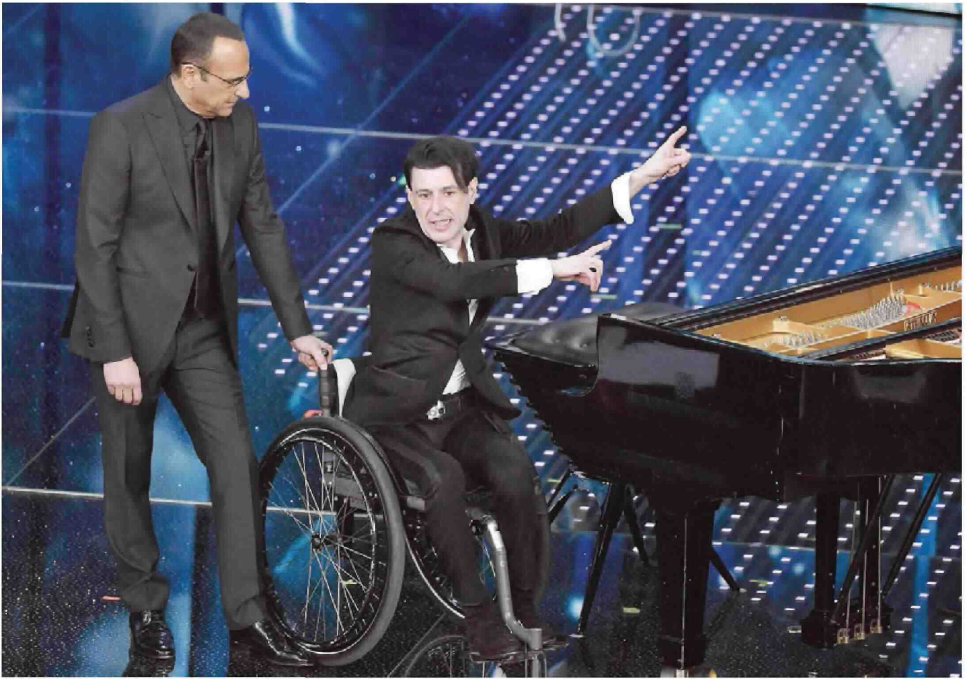
Il maestro Ezio Bosso, affetto da Sla, protagonista mercoledì sera sul palco dell'Ariston di Sanremo col presentatore Carlo Conti