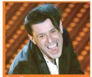
Ezio Bosso, che successo