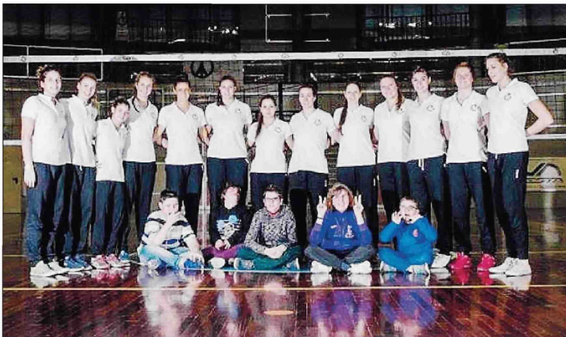
Uguali... Diversamente con le ragazze della Beng