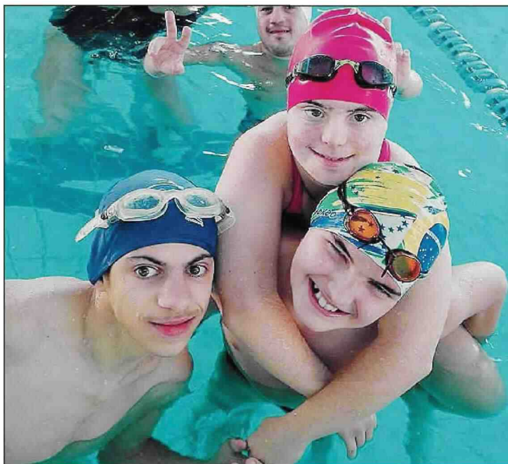
Tanti piazzamenti di prestigio per la società rodigina