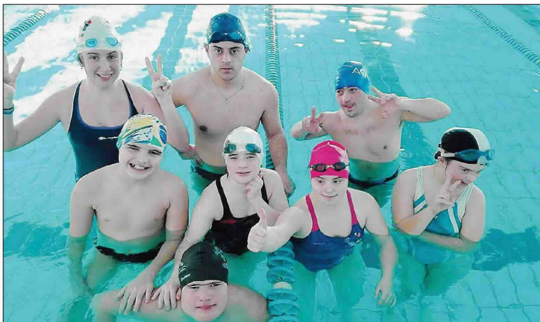
Gli atleti di Uguai... Diversamente si divertono in vasca