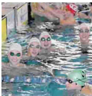
Nelle foto alcuni momenti della bella giornata trascorsa in piscina in occasione del Trofeo Città di Fermo che si è tenuto nei giorni scorsi