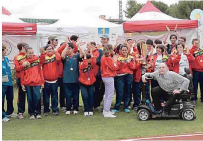
IN CAMPO La squadra dell'Anthropos Civitanova