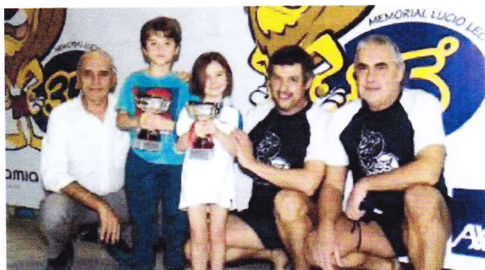
Un momento delle premiazioni dei piccoli atleti

Al centro federale sfida tra 330 bimbi oltre a una staffetta per ricordare Castagnetti