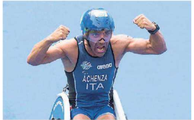
Gianni Achenza, bronzo nel paratriathlon ai Giochi di Rio 2016