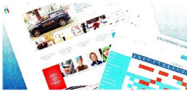
La home page del sito Coni dedicato a PyeongChang 2018

Da ieri è online il sito http://www.pyeongchang2018.coni.it dedicato all'Olimpiade invernale di Pyeongchang 2018. L'iniziativa del Coni, realizzata accompagnerà le atlete e gli atleti azzurri durante il loro percorso fino ai Giochi che inizieranno il 9 febbraio. Durante le Olimpiadi il