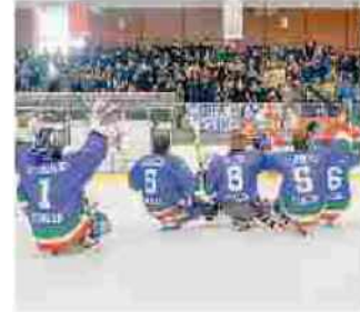
La gioia dopo la vittoria di ieri