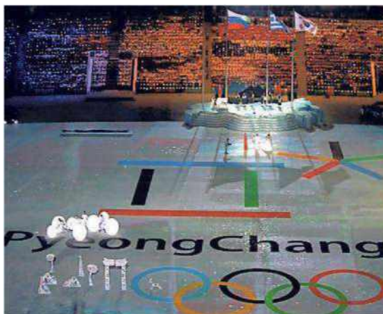
2014, cerimonia finale: da Sochi a PyeongChang