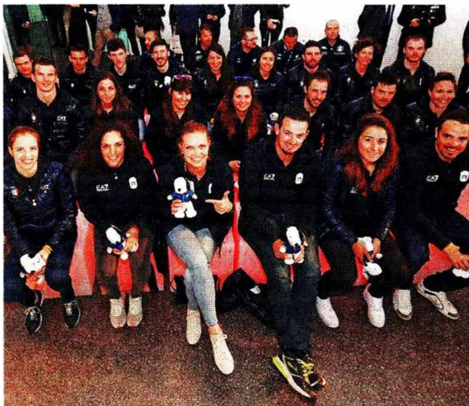
Il gruppone degli azzurri degli sport invernali al Museion di Bolzano CONI-FERRARO